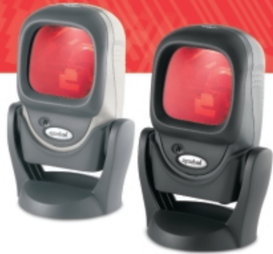
Compatible con 2005 Sunrise Date

Si desea más información sobre cómo encaja el lector fijo LS 9208 en sus procesos, o sobre otros productos y soluciones de Symbol, póngase en contacto con nosotros en el +1 800 722 6234 o +1 631 738 2400, o visite www.symbol.com/ls9208 .