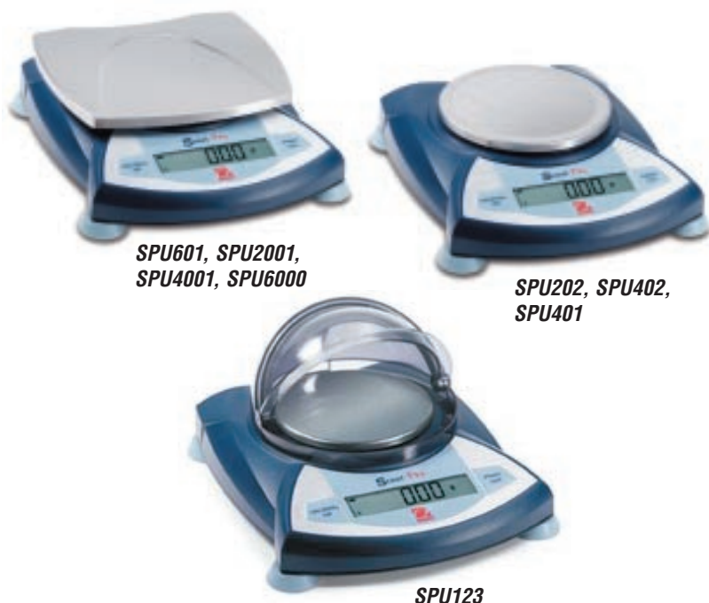
SPU601, SPU2001, SPU4001, SPU6000